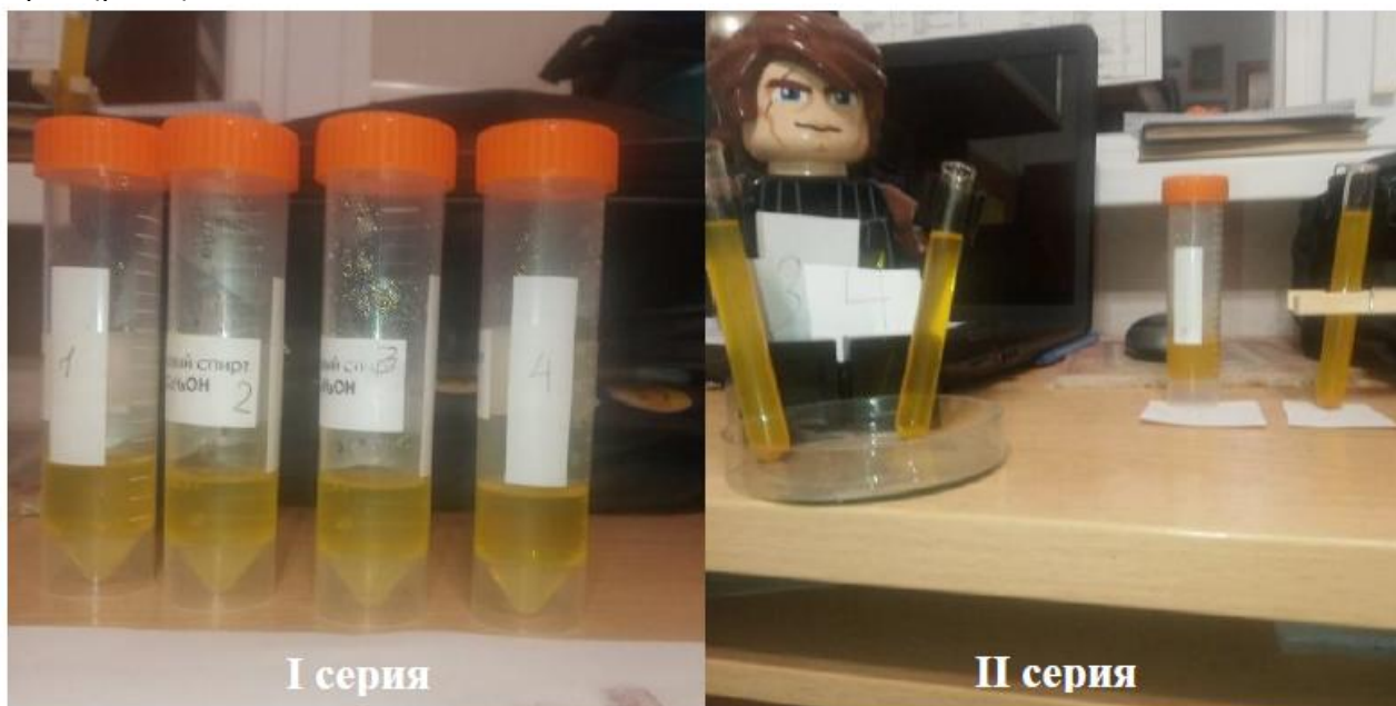
Рис. 2. Первая пробирка с добавлением мальтодекстрина;

На втором этапе получаем золь наночастиц куркумина. Используем метод замены растворителя. Экстракт куркумина (спиртовой раствор) добавляем в большой объем дистиллированной воды, которая является для куркумина плохим растворителем, но хорошо смешивается со спиртом. Ход экспериментов представлен в таблице 1. Концентрацию используемого экстракта куркумина увеличиваем в четыре раза. Поскольку в исследовании анализируется использование стабилизаторов: ПВП и мальтодекстрин, то в заключительной стадии эксперимента разделяем полученные растворы с разной концентрацией куркумина на четыре части, в каждую добавляем или не добавляем соответствующий стабилизатор. Таким образом, получаем по четыре образца в каждой серии (рис.2):