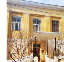
Кафедра биофизики биологического факультета д.1, стр.24