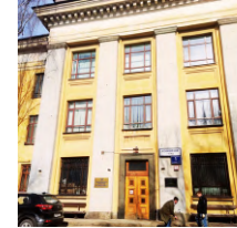
Кафедра радиохимии д.1, стр. 10