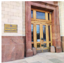
Химический факультет д.1, стр.3