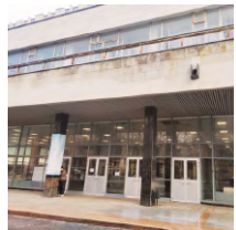
2-й учебный корпус д.1, стр.52