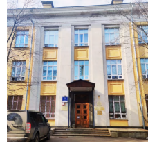
Кафедра химической технологии и новых материалов д.1, стр.11