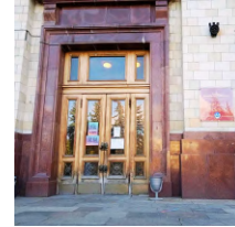
Физический факультет д.1, стр.2